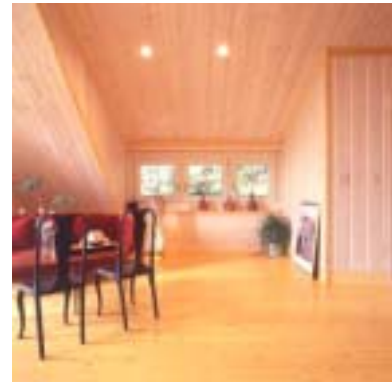
(写真 左:1階リビングダイニング、中央・右:2階ロフト)

大勢で寛げるほどの空間が、1階・2階にある。1階はオープンスペースになっており、クッキングストーブや家具調キッチンのレトロ感が、ログと交わって不思議と落ち着いた空間を演出している。2階のロフトは、多目的に使えるようオーナーのこだわりがある。